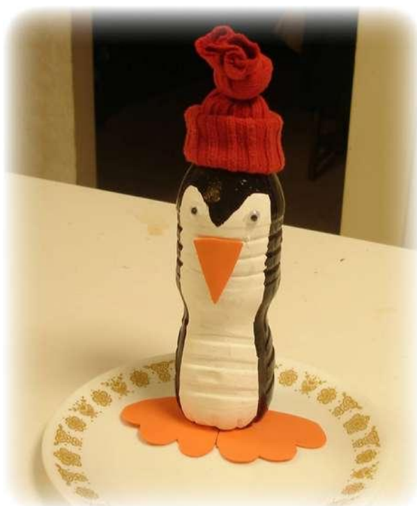
Фото как сделать эти поделки своими руками. Все очень просто и захватывающе. Такими поделками можно украсить прогулочную площадку детского сада или дачный участок.