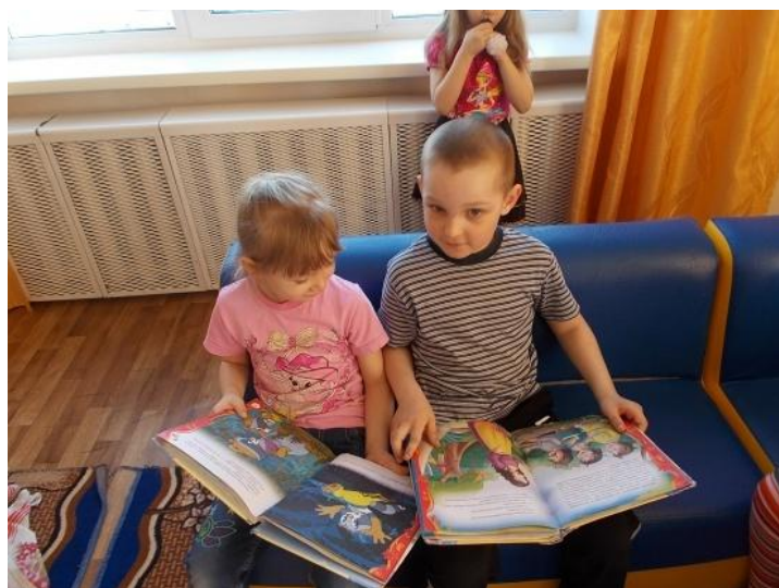
В библиотеке. На диванчике своем книжки мы сейчас прочтем