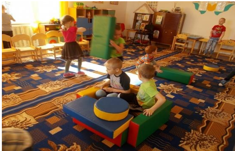
Данил и Сережа отправляются на автомо

Дети по мостику аккуратно идут, в речку они не попадут.